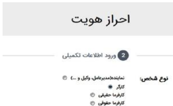
شکل 3- انواع احراز هویت

2-3- بعد از انتخاب احراز هویت الکترونیکی، صفحه شکل 3 به همراه الزامات احراز هویت به نمایش در می‌آید.