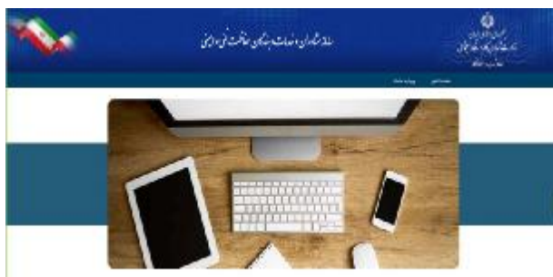
شکل 16- صفحه شروع سامانه

4-1- مراجعه به نشانی اینترنتی https://scp.mcls.gov.ir و نمایش صفحه شکل 16 و انتخاب «ورود به سامانه».