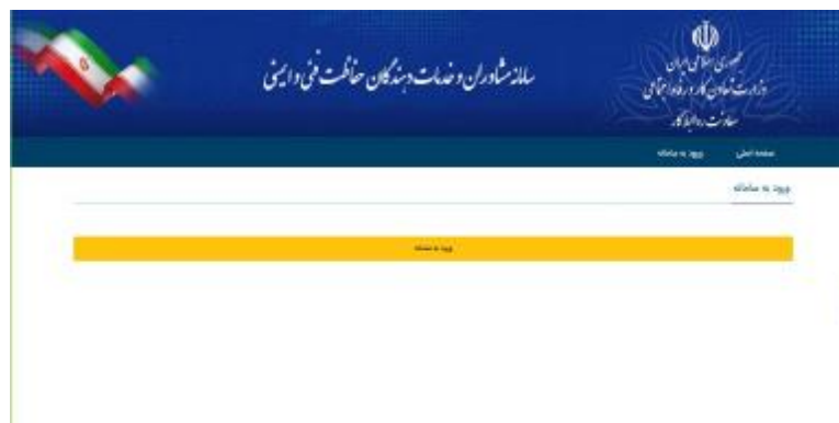
شکل 17- ورود به سامانه

4-2- ورود به سامانه انتخاب شود (شکل 17).