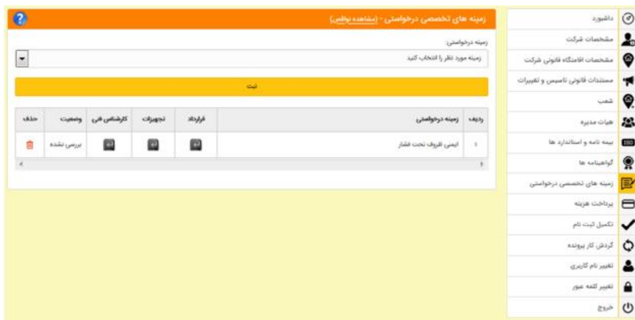
شکل 26- زمینه های تخصصی درخواستی

4-4-8- زمینه های تخصصی درخواستی: در این قسمت، شرکت زمینه های تخصصی درخواستی را اعلام می کند تا در آن زمینه ها بر اساس آیین نامه و دستورالعمل اجرایی آن در صورت داشتن شرایط رتبه بندی شود (شکل 26).