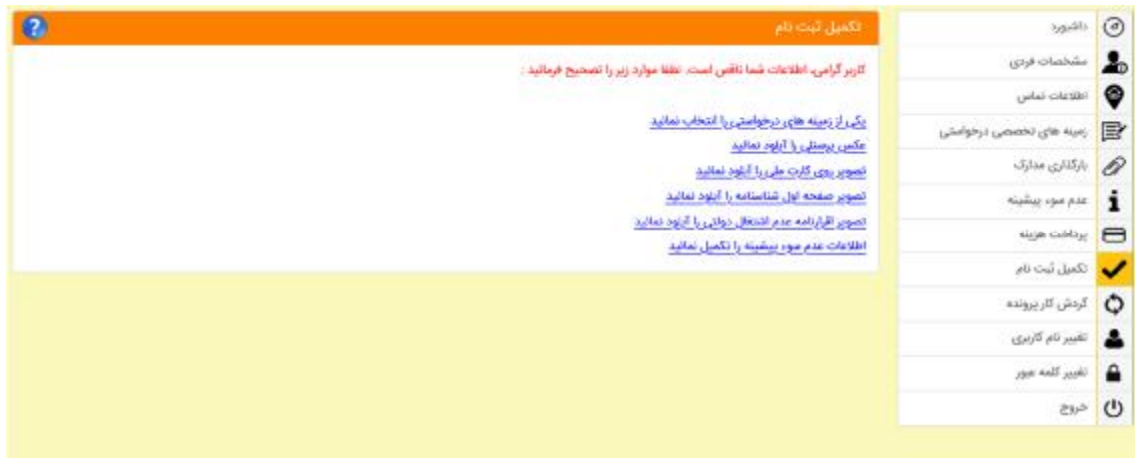
شکل 15- فرم تکمیل ثبت نام

3-4-7- تکمیل ثبت نام: در این قسمت موارد نقص ثبت نام به اطلاع متقاضی رسانده می شود و متقاضی باید با کلیک بر آنها، نسبت به رفع نقص اقدام کند (شکل 15).