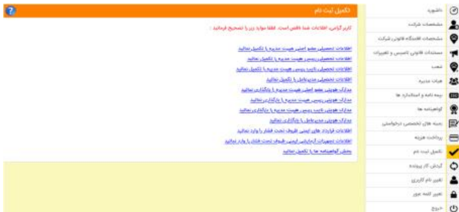
شکل 30- تکمیل ثبت نام

توجه: تکمیل فرایند ثبت نام منوط به اخذ کد رهگیری از سامانه می باشد.