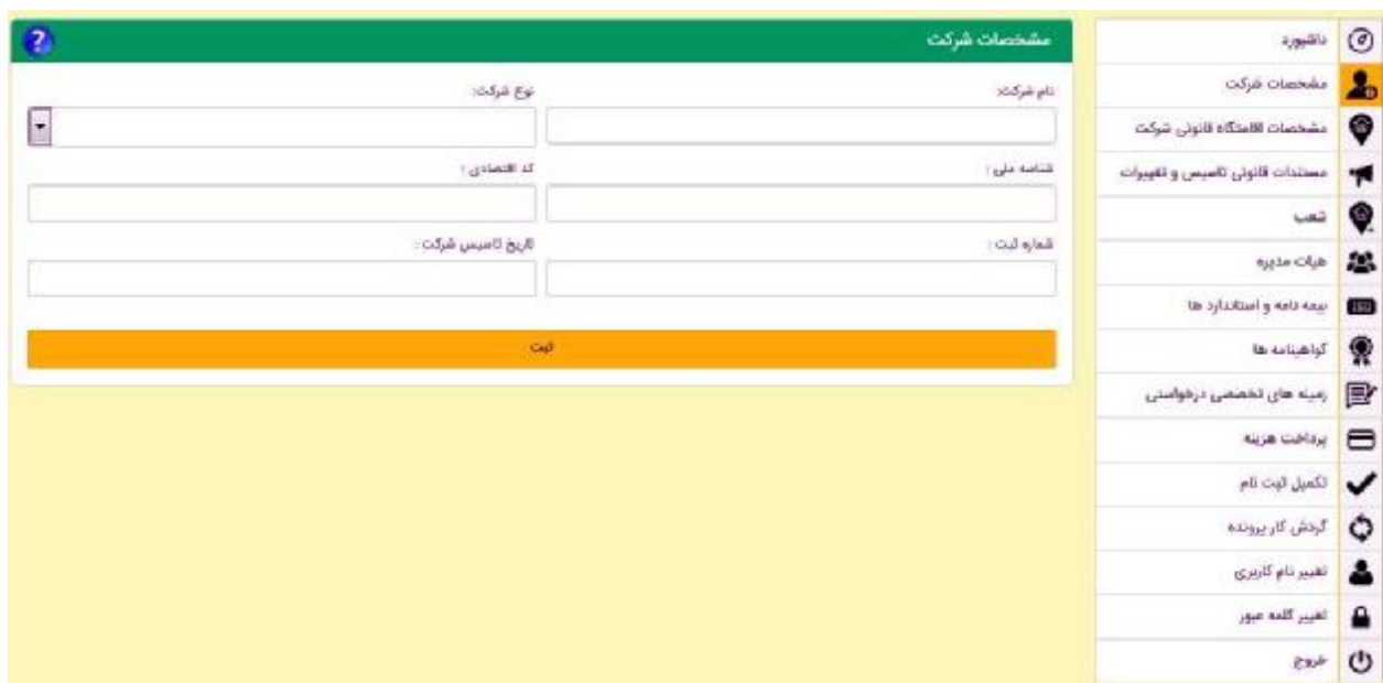
شکل 19- مشخصات شرکت

4-4-1- مشخصات شرکت: در این قسمت متقاضی باید مشخصات شرکت شامل: نام شرکت، نوع شرکت، شناسه ملی، کد اقتصادی، شماره ثبت و تاریخ تاسیس شرکت را وارد کند.